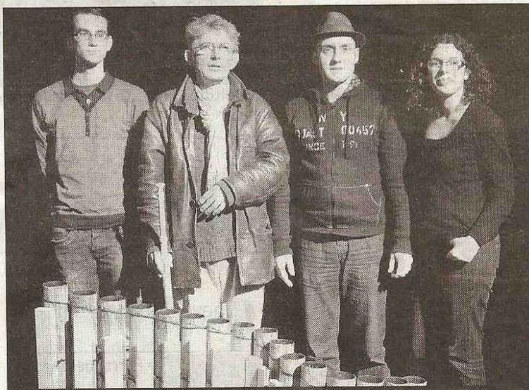
Dans le spectacle Animaé, la « lutherie urbaine » fabriquée par la compagnie côtoie la « lutherie conventionnelle »

La compagnie ébroïcienne Itinéraire bis connaît actuellement un pic d'activité dû à sa créativité, à son approche artistique liant théâtre, poésie, musique et insolite, ainsi qu'à son art de la scénographie et de la dramaturgie, qui font de ses spectacles vivants des moments forts et envoûtants. Vingt-sept années au service de la recherche et de la création ont